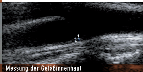
Messung der Gefäßinnenhaut